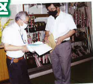
社明作文原稿依頼