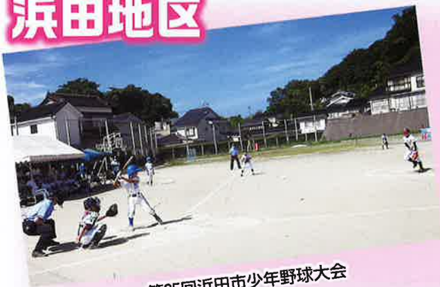
第35回浜田市少年野球大会