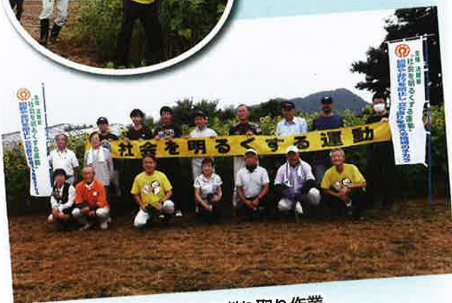
ひまわりの刈り取り作業