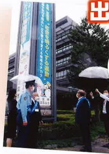
懸垂幕、横断幕設置