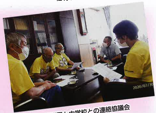
保護司と中学校との連絡協議会