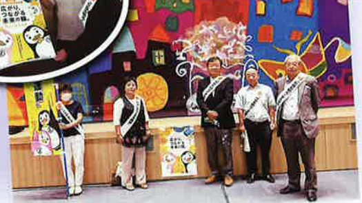
社明ポスター掲出依頼