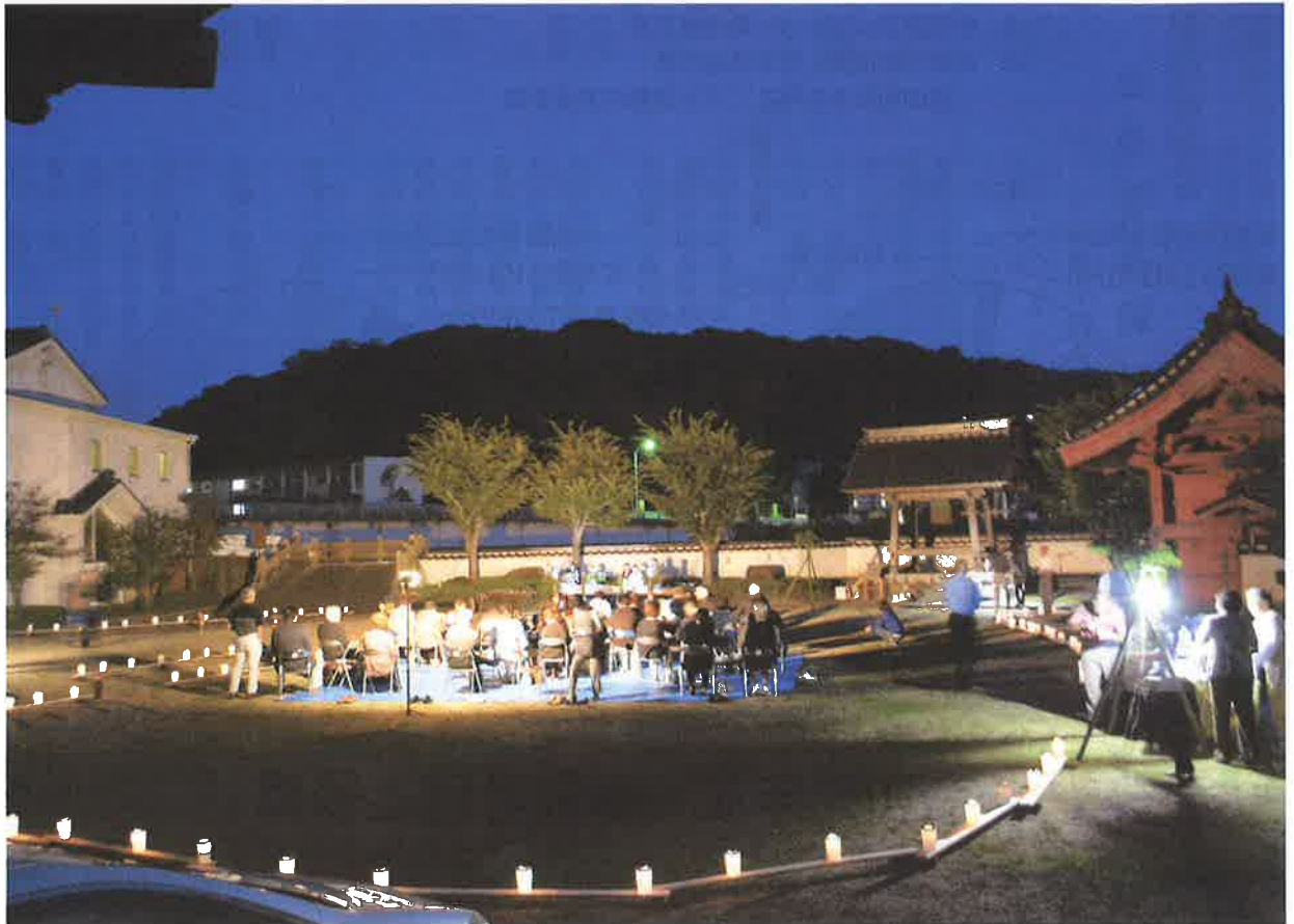
萬福寺におけるお月見会

平素より皆様方には、島根保護観察協会の事業推進につきまして多大なるご支援・ご協力を賜り厚く御礼申し上げます。お陰をもちまして昨年度は当協会の所期の目的を達成し、更生保護事業の伸展に寄与することが出来たものと思っております。