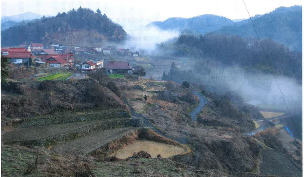
天空の集落

平素より皆様方には、島根保護観察協会の事業推進につきまして多大なるご支援・ご協力を賜り厚く御礼申し上げます。お陰をもちまして昨年度は当協会の所期の目的を達成し、更生保護事業の伸展開に寄与することが出来たものと思っております。