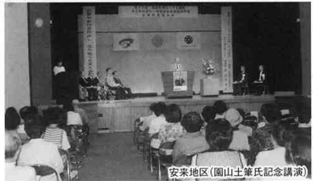
安来地区(園山土筆氏記念講演)