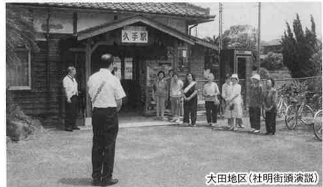
大田地区(社明街頭演説)