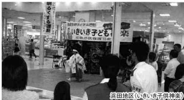
浜田地区(いきいき子供神楽)