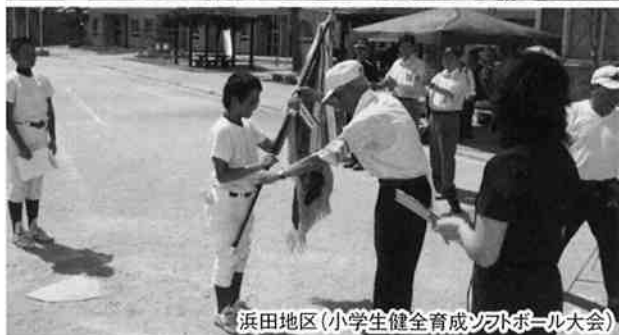
浜田地区(小学生健全育成ソフトボール大会)