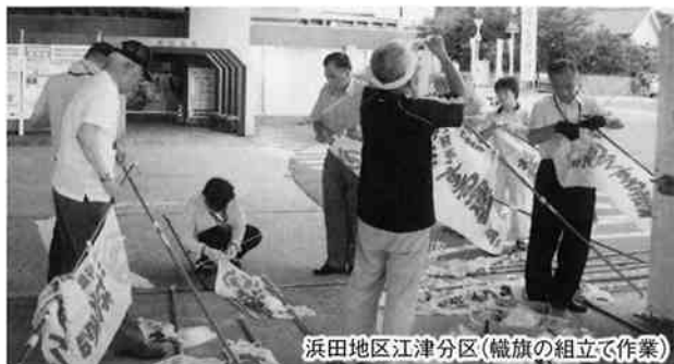
浜田地区江津分區(幟旗の組立て作業)