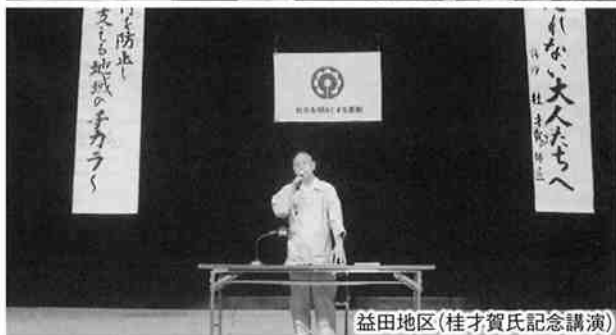
益田地区(桂才賀氏記念講演)