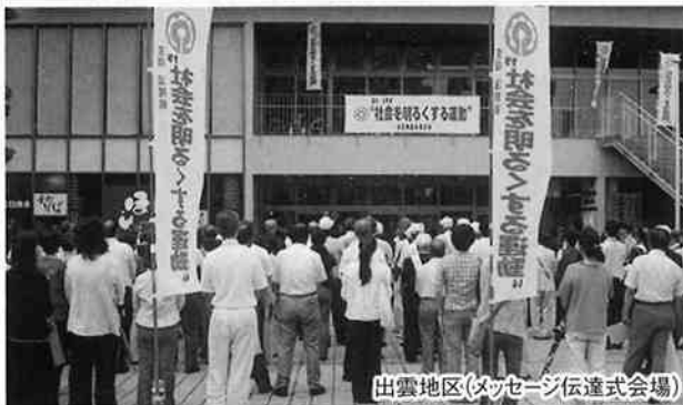
出雲地区(メッセージ伝達式会場)