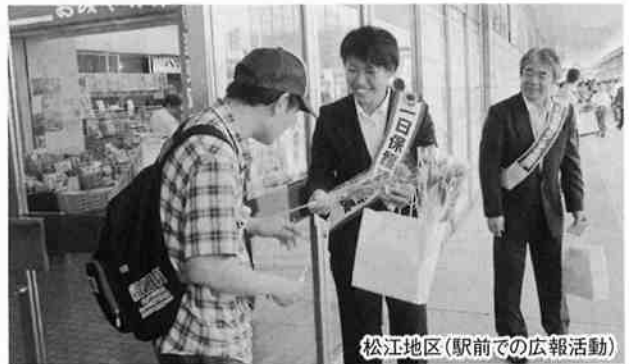
松江地区(駅前での広報活動)