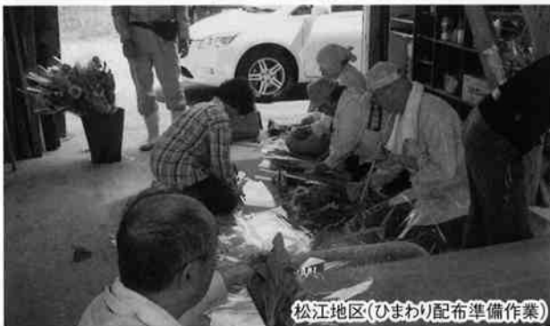
松江地区(ひまわり配布準備作業)