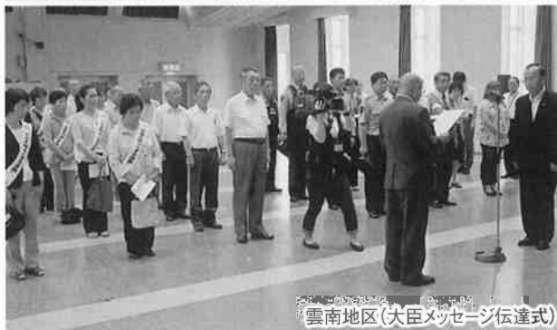
雲南地区(大臣メッセージ伝達式)