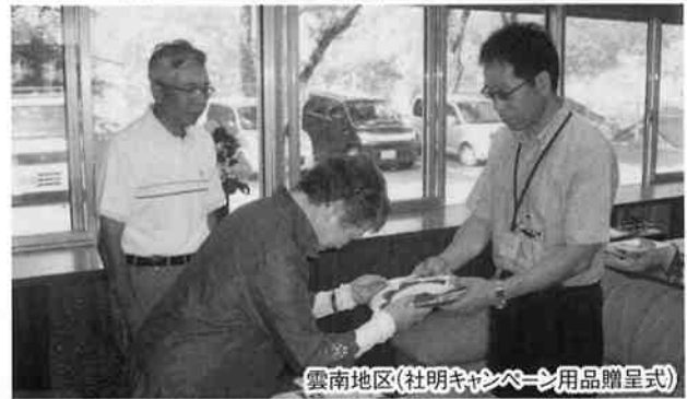
雲南地区(社明キャンペーン用品贈呈式)