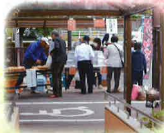
雇用主会の皆様も出店にご協力いただきました。