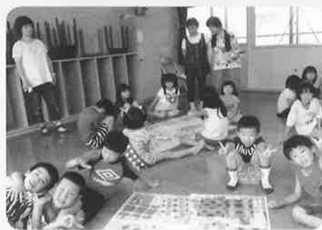
流し染め 子ども広場の子ども

などの昔遊びで交流しています。抹茶体験も喜んでくれます。昨年から、登校の見守りをはじめました。この様に、地域