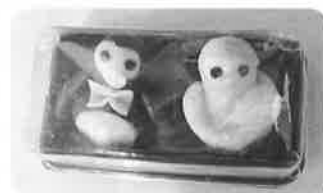
広島更女から参加者宛和菓子（ホゴちゃん和サラちゃん）

最後に講評として中国地方更生保護委員会委員長さまより、「更女は各地区になくはない組織、こつこつ活動してきた前任者がどんな思いで始めたかを思いつつ、続けてきた活動に勇気をもって前に進んでほしい」と話されました。