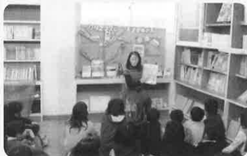
東小に絵本読み聞かせ

平成21年度「ミニ集会」モデル地区活動の指定を受け、実践し、効果をあげたので、以後継続していこうと話し合い、支部の実情にあった活動、地域の人との交流会を続け、女性会の活動のPRにつなげていきます。