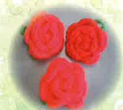
会員は会員手作りのバラのコサージュを胸に参加しました。