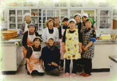
来場者のお弁当は 会員さんのご協力でできました。