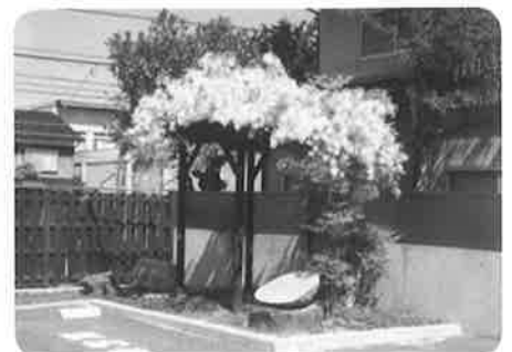
母親の願いのこもった満開の白藤