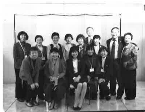
講師の先生方を囲んで 中国・四国地方の参加者

3日間の研修を終え全国各地での更女の活発な活動、また課題等、様々なことを学び、これからの更女活動に少しでも活かしていきたいと思いました。何よりもたくさんの方と知り合えたこと、内容の深いとても有意義な研修会を終えました。