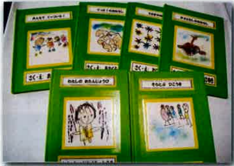
わたしの誕生日（3才児）