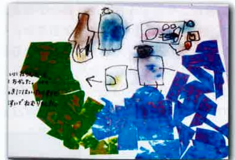
手術はこわくないよ（4才児）

本を読むことによって、子どもたちには素晴らしい感性が育って来ました。だから絵本が作れました。いつも子どもに見えるところにこの本を置いてほしいです。